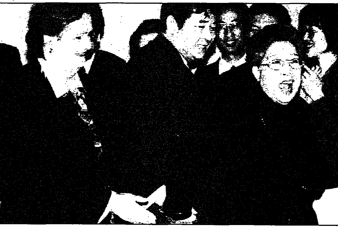
وزيرة التجارة الصينية (يمين) تجدد رئيسة الوفد الأمريكي للفاوض الى احتمال في اعقاب توقيع اتفاقية المنسوجات امس في بيكين

التصدير. وردت الصين بفرض حظر مؤقت على استيراد بعض المنسوجات والمنتجات الزراعية والمنسوجات الكحولية الامريكية ولكن ارجأت تنفيذ